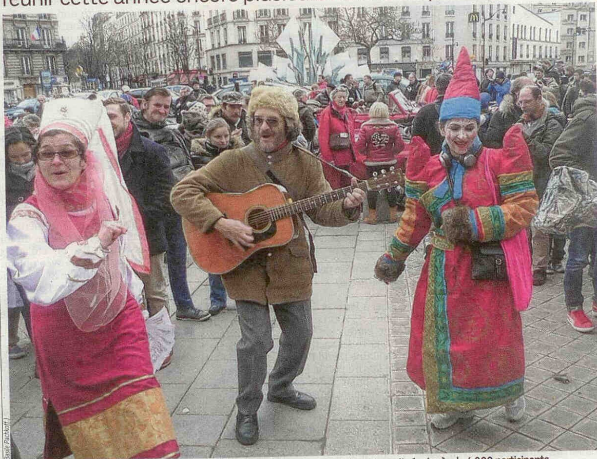
Place Gambetta (XX e ), en 2015. Lors de sa précédente édition, le carnaval de Paris avait réuni près de 4 000 participants.

DÉFILÉ. Pour sa 19 e édition, dimanche, l'événement devrait réunir cette année encore plusieurs milliers de participants.